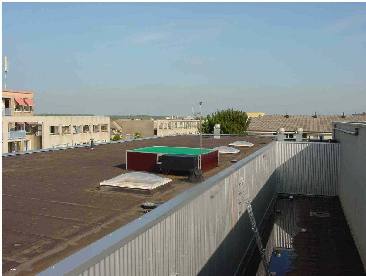
Luistervink 2004-600 met microfoonhuis